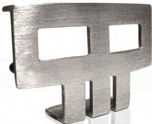
klein / geschliffen / ME9 0007-01