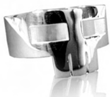
Ring, poliert / ME9 0004