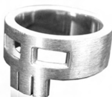
Ring, geschliffen / ME9 0004-B