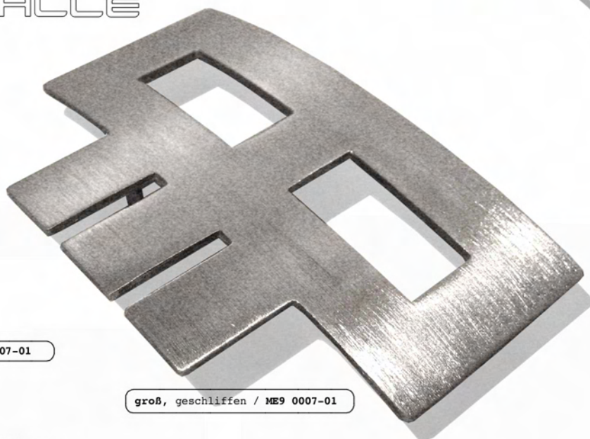
groß, geschliffen / ME9 0007-01